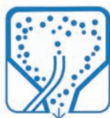
Séchage par atomisation