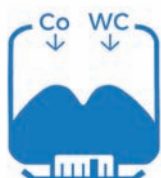
Pesée des ingrédients